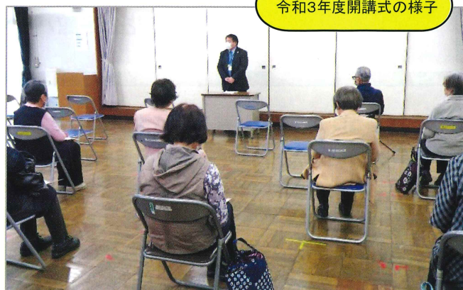
令和3年度開講式の様子